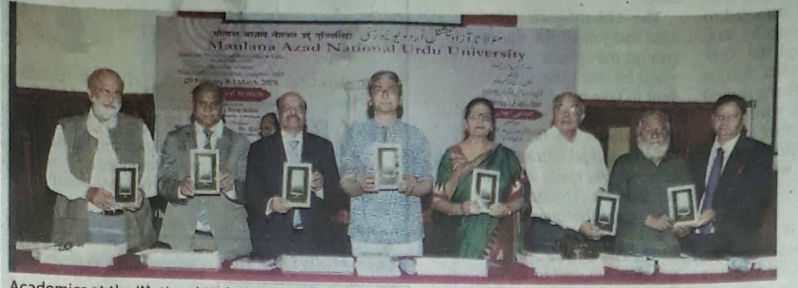
Academics at the 'National Urdu Science Congress-2019' at Maulana Azad National Urdu University in Hyderabad on Thursday.

Several books written in Urdu on a wide range of topics released